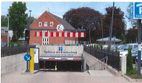
Parkhaus am Krankenhaus